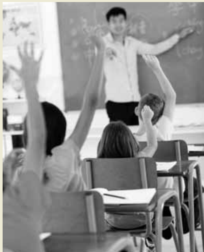
Un profesor da una explicación a un alumno.

Si la semana pasada era Andalucía la Comunidad que convocaba oposiciones para profesor de secundaria, ahora es Galicia. De las 117 plazas que ofertan 86 son libres. Se celebrarán a partir del 19 de junio