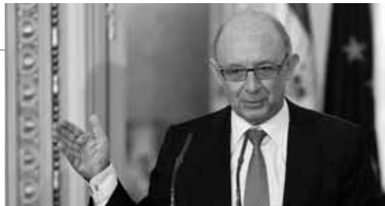
Cristóbal Montoro el día que anunció la convocatoria.

mente. De éstas, 238 plazas, de nueva creación, serán para la Agencia Tributaria para reforzar la lucha contra el fraude y 210 efectivos más en la escala de funcionarios locales, así como un número "importante" de plazas reservadas para promoción interna en los Cuerpos de la Administración del Estado, que se convocarán este año.